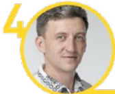
Павло Дзюблик Житомирська область

Представники фракції «Народний фронт» вкотре очолили рейтинг кращих депутатів-мажоритарників, складений громадянською мережею ОПОРА. У результаті аналізу законодавчої роботи та активності депутатів у виборчих округах за серпень-вересень 2016 року автори рейтингу віддали перші чотири місця представникам «Народного фронту». Зокрема, лідером визнано представника Волинської області Ігоря Гузя. Друге місце посів Олександр Кодола, який обраний від округу в Чернігівській області, третє – голова фракції «Народного фронту» Максим Бурбак, що представляє Чернівецьку область, а четверте – Павло Дзюблик, що обраний від округу на Житомирщині. Крім того високу активність у роботі продемонстрували представники фракції Олег Медуниця, що обирався на Сумщині (13 місце), Юрій Вознюк з Рівненщини (19), Микола Федорук з Буковини (27), Анатолій Дирів з Івано-Франківщини (31) та інші. Всього ОПОРА проаналізувала діяльність 105 депутатів різних фракцій.